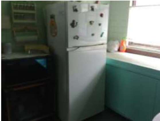
Refrigerador Amplio Microondas

Tel (771)7182028 Fax (771)7138380 http://www.corporativohecatl.mex.tl Correo: corporativohecatl@hotmail.com