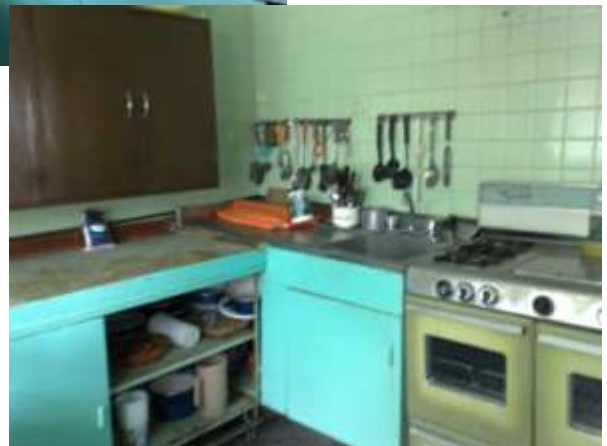
Estufa con Hornos de Gas