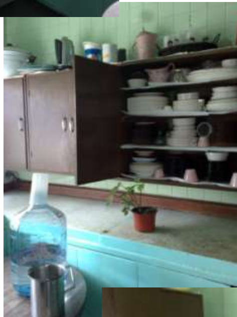
Bajilla y Mesa de trabajo